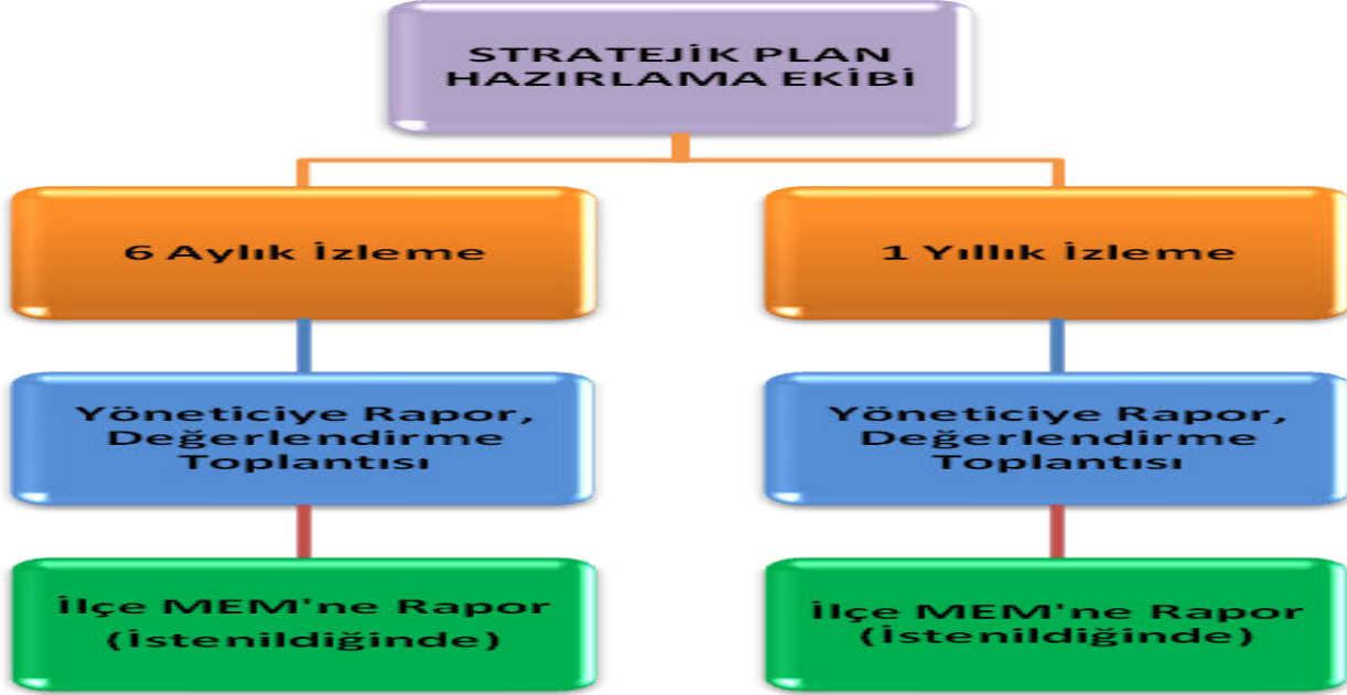
Tablo 26: İzleme ve Değerlendirme Şablonu

Müdürlüğümüzün 2024-2028 Stratejik Planı İzleme ve Değerlendirme sürecini ifade eden İzleme ve Değerlendirme Modeli hazırlanmıştır. Müdürlüğümüzün Stratejik Plan İzleme-Değerlendirme çalışmaları eğitim-öğretim yılı çalışma takvimi de dikkate alınarak 6 aylık ve 1 yıllık sürelerde gerçekleştirilecektir. 6 aylık sürelerde Üst Yöneticiye rapor hazırlanacak ve değerlendirme toplantısı düzenlenecektir. İzleme-değerlendirme raporu, istenildiğinde Stratejik Geliştirme Başkanlığına gönderilecektir. 1 yıllık izleme-değerlendirme çalışmaları, Stratejik Planımızda yer alan hedeflerin yıllık düzeyde ifade edildiği Performans Programı ve yılsonunda gerçekleşme düzeylerinin belirlendiği Faaliyet Raporu hazırlanarak yapılacaktır. Performans Programı ve Faaliyet Raporu Üst Yöneticinin değerlendirmesinin akabinde Strateji Geliştirme Başkanlığına ve Mülki İdari Amire sunulacaktır. Yıllık izlemelerle ilgili değerlendirme toplantıları